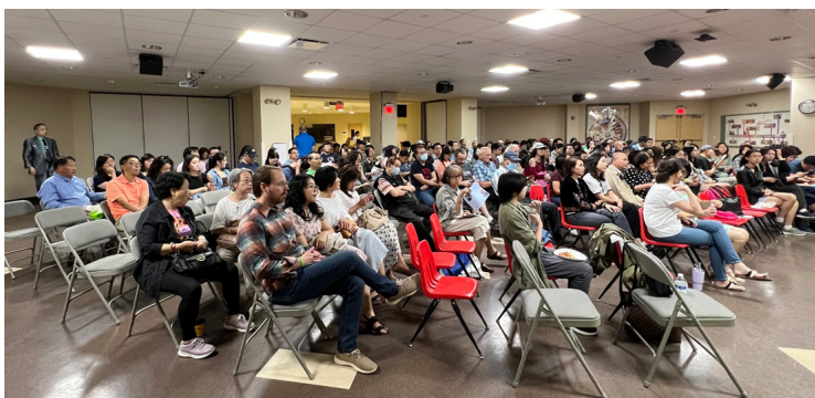
若歌教會禮堂等待看電影Sight(光明)的觀眾

1982年，王明旭畢業於中國科技大學被保送美國留學。獲哈佛和MIT聯合醫學博士和馬里蘭大學鐳射物理博士後，王明旭成為田納西州納什維爾市的一名眼科醫生，擁有發明羊膜隱形眼鏡技術的美國專利，他是世界最大的眼科集團愛爾集團美國分部的CEO，成績卓著傲人。